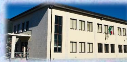
SCUOLA SECONDARIA DI I GRADO DI LEFFE