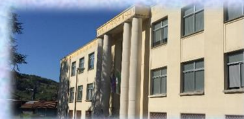
SCUOLA PRIMARIA DI LEFFE

“Del tempo della scuola resterà nella vita un'intensa memoria di volti senza tempo. Nel tempo della scuola si coltiveranno sogni e speranze. Con il tempo della scuola sorgeranno coscienze libere. Dal tempo della scuola vibreranno soavi pensieri e roboanti e sagge parole”.