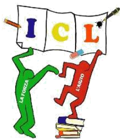
ISTITUTO COMPENSIVO DI LEFFE